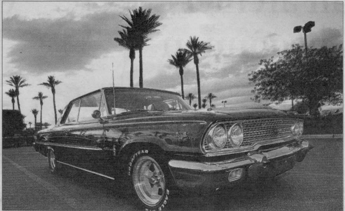
Op zoek naar een goede baan en geluk reizen moeder en de twee dochters in een oude Ford Galaxie naar Californië. De auto dient de eerste weken ook als huis.